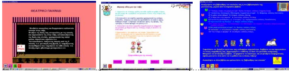
σχήμα 4: «δραστηριότητες από το Γ΄ μέρος»

Όλες αυτές οι ενότητες γνώσης ή κόμβοι αποτελούν μια κατά τα άλλα δομημένη διάταξη η οποία εξετάζει την έννοια « Τέσσερις Εποχές». Ο μαθητής μας μπορεί να ξεκινήσει από οποιοδήποτε κόμβο. Ο κάθε κόμβος μπορεί να λειτουργήσει ανεξάρτητα και συμπληρωματικά με τους υπόλοιπους, ενισχύοντας έτσι την αλληλεπίδραση, την κατανόηση και την οικοδόμηση της γνώσης.