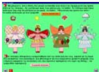
σχήμα 1: «Καλλιτεία Εποχών»