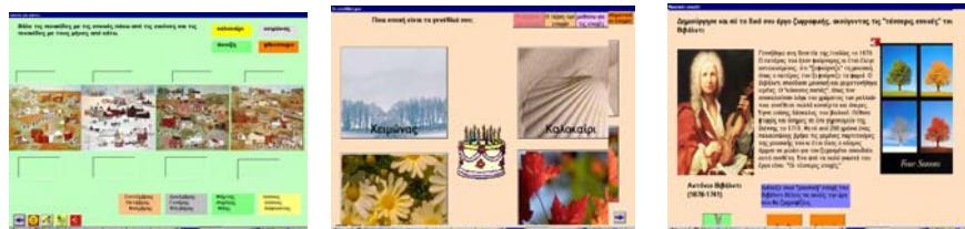
σχήμα 3: «δραστηριότητες από το Β΄ μέρος»